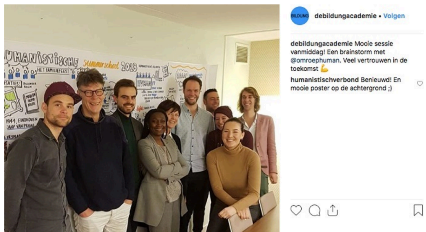
Een brainstormsessie

In 2015 werd door een groepje studenten en docenten De Bildung Academie opgericht. Een onderwijsinitiatief waarin niet alleen aandacht is voor cognitieve, kritisch-analytische oefening, maar ook voor brede vorming op het gebied van empathie, expressie, ethiek, creativiteit en ondernemerschap. Human is vanaf het prille begin een belangrijke samenwerkingspartner. Al tijdens de eerste schetsen van De Bildung Academie deelden wij kennis, ervaring en materialen over en weer. Lees hier het hele verhaal.