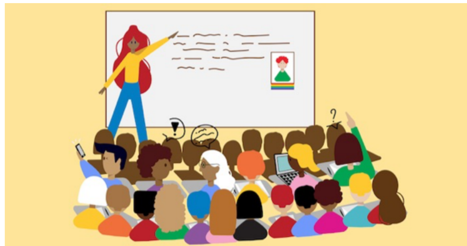
Help ons en vul de enquête in

Jullie weten het natuurlijk als geen ander, educatieprofessionals zijn altijd bezig met innoveren en verbeteren. Ook HUMAN Educatie is op dit moment bezig met het vernieuwen van zijn lesdossiers. De meest waardevolle input voor dit onderzoek is de input en feedback van mensen in het vak. Werk jij met lesmateriaal van HUMAN Educatie en wil je ons verder helpen met het verbeteren van onze dossiers? Vul deze (anonieme) enquête over ons lesmateriaal in. Het invullen duurt maximaal 5 minuten en onder de respondenten verloten we een inspirerend boek. Bij voorbaat dank!