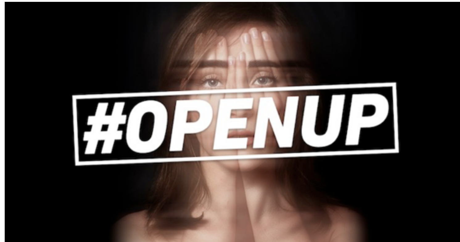
Het lesdossier mentale gezondheid

Somberheid, angsten, eenzaamheid, burn-outs, depressies of 's nachts piekeren. Uit verschillende onderzoeken blijkt dat jongeren en jongvolwassenen door de coronacrisis meer dan andere leeftijdsgroepen mentale gezondheidsproblemen ervaren. Veel (jonge) mensen schamen zich voor hun klachten, terwijl openheid juist voor verlichting kan zorgen. Daarom heeft HUMAN Educatie met MIND en 113 het lesdossier mentale gezondheid ontwikkeld, waarbij jij, als onderwijsprofessional, het gesprek in de klas kan voeren over psychische problemen en prestatiedruk. Het lesmateriaal is te gebruiken in het primair onderwijs, voortgezet onderwijs en het mbo.