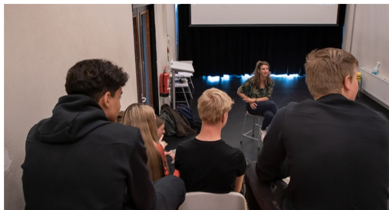
Kijkje in klas bij les De Vloer op Jr.

Werk je met HUMAN Educatie-lesmateriaal en lijkt het jou leuk als we een kijkje nemen in jouw klas om andere onderwijsprofessionals te inspireren? Stuur dan een mailtje naar educatie@human.nl .