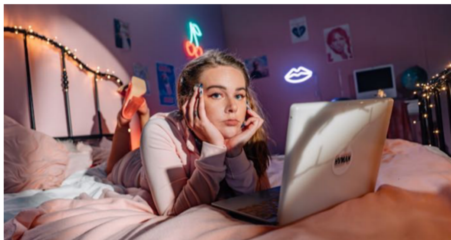
In de 3LAB: Tessel in Cyberspace onderzoekt Tessel hoe effectief het zogenoemd hashtag-activisme eigenlijk is

Hoe blijf je kritisch, ook op cijfers, percentages en grafieken? Isdatechtzo.nl vroeg het aan hoogleraar wetenschapscommunicatie Ionica Smeets. Lees hier het artikel.