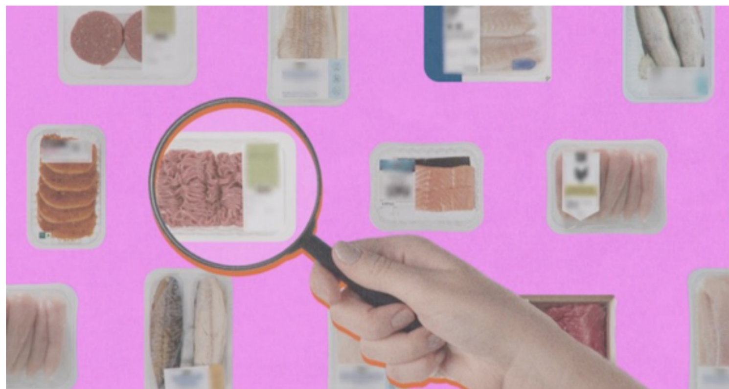
Het vernieuwde klimaatdossier met bijhorende vragen en video’s © HUMAN / Wat houdt ons tegen?

Wat houdt ons tegen om minder voedsel te verspillen? Wie ligt wakker van de klimaatverandering? Wie zou alles van een dier kunnen eten? En wat kan je allemaal doen voor het klimaat? Deze en meer filosofische vragen met bijhorende video’s kan je in je les gebruiken om het onderwerp klimaat te bespreken. Bekijk het vernieuwde klimaatdossier .